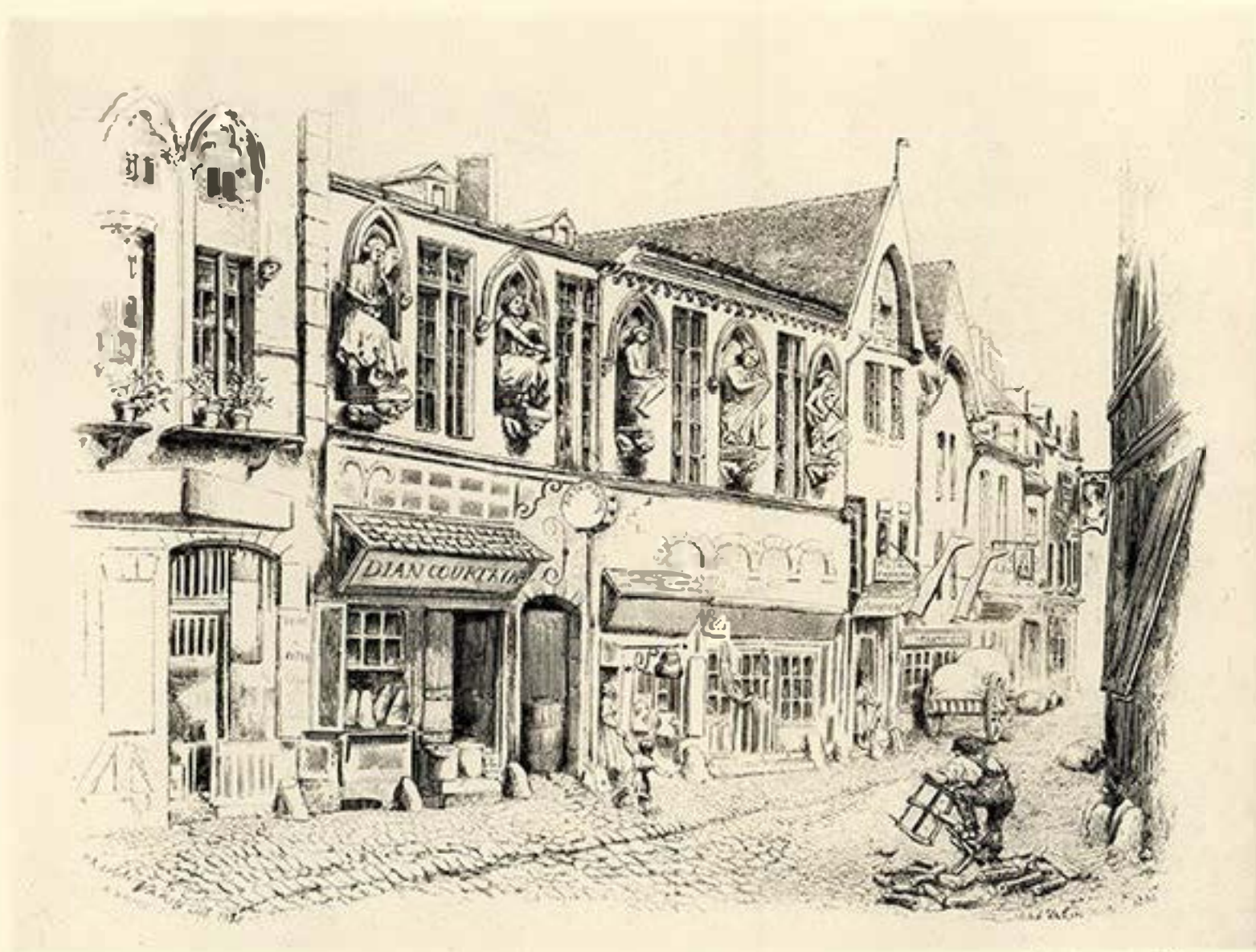
MAISON DES MUSICIENS, RUE DE TAMBOUR, A REIMS